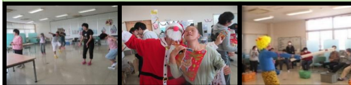
ミュージックセラピー